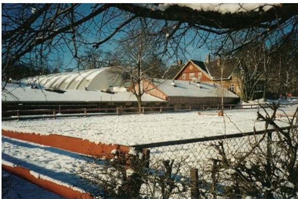
Ridebanen set fra Strandvejen

Nu vil man muligvis indvende, at disse foranstaltninger ikke er optimale for hestens ben. Dertil er at sige, at jeg har benyttet både såler og mordax hver vinter de sidste 40 år uden problemer. Flere af mine heste er blevet over 20 år, og de har aldrig haft skader på grund af ovenstående.